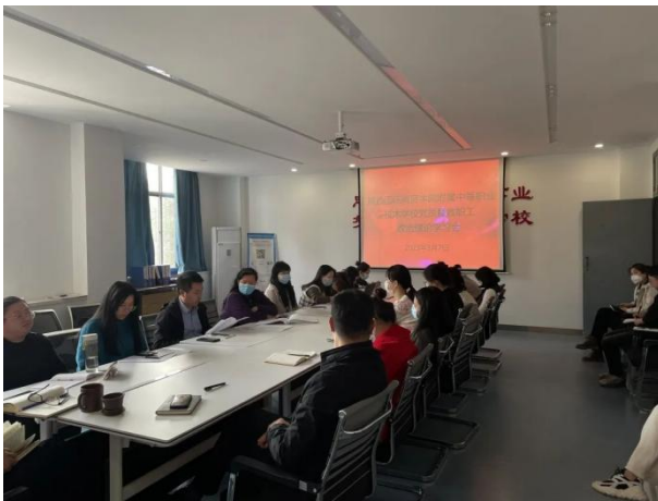
全体教师政治理论学习会