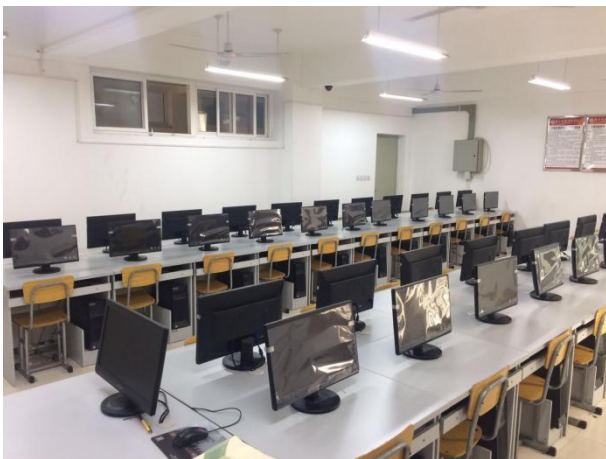
计算机网络实验室