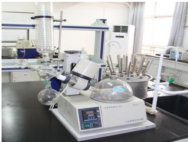
图六：中药制药专业实训室情况