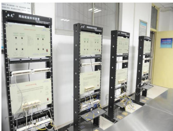
网络综合布线实验室