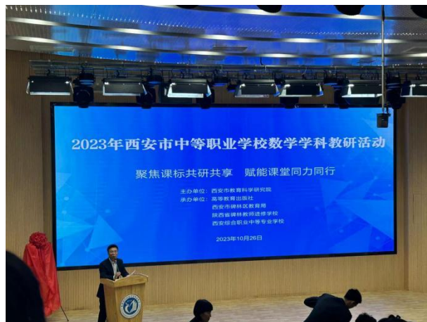
参加2023年西安市中等职业学校英语、数学教科研活动