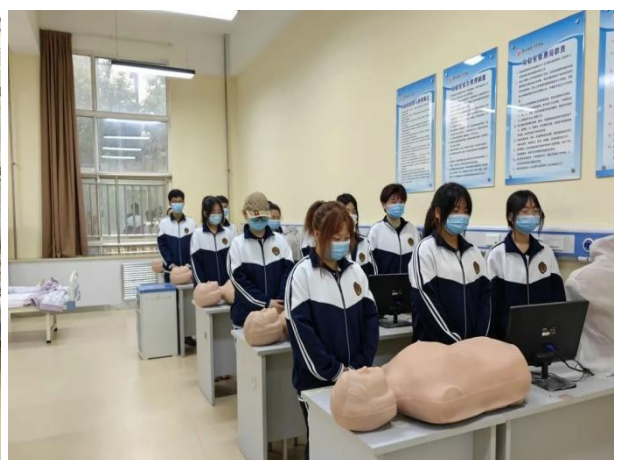
护理操作演示实训室