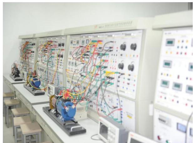
电力电子及电动拖动实验室