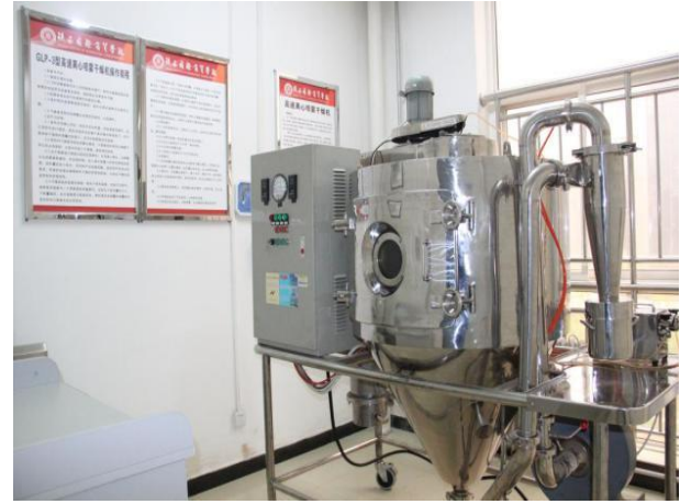
中药前处理、提取实训车间