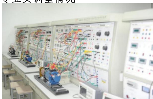
电力电子及电动拖动实验室