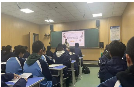
教师参加职教好课堂比赛