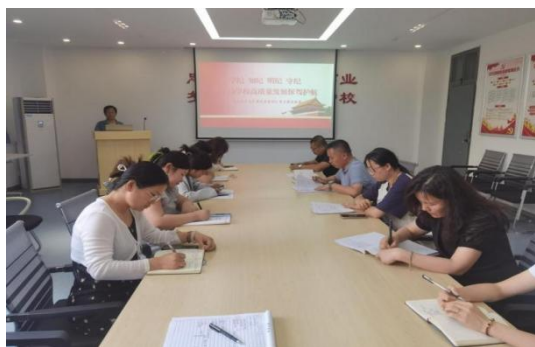
党纪学习教育活动