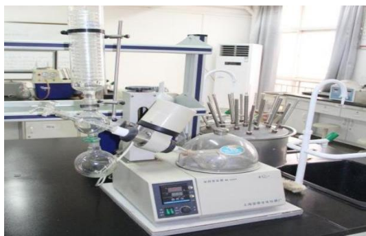
图 5：中药制药专业实训室情况