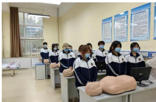
护理操作演示实训室