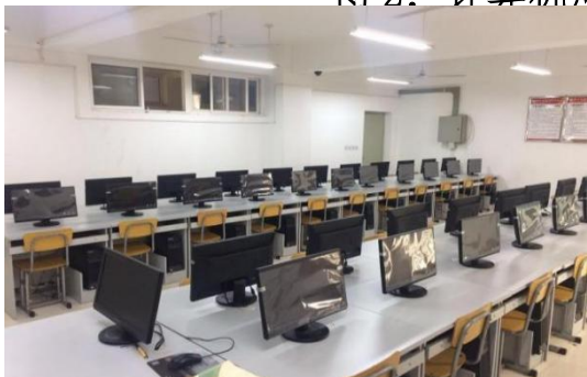
计算机网络实验室