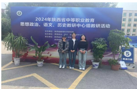
教师参加学科组教研活动