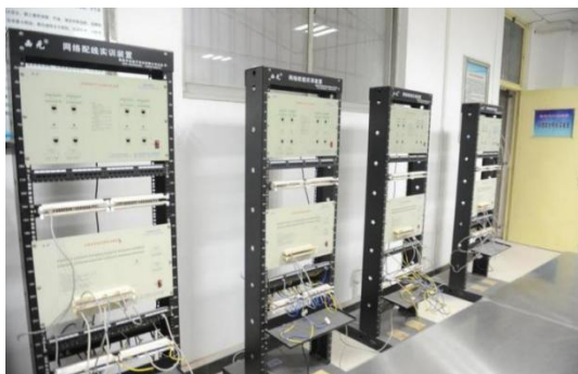
网络综合布线实验室