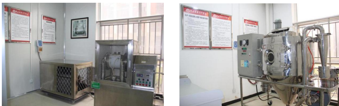
中药前处理、提取实训车间