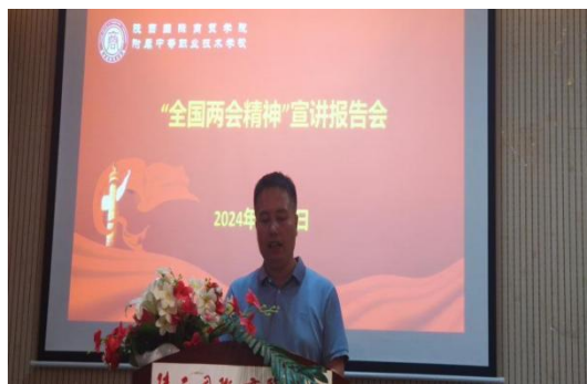
全国两会精神宣讲